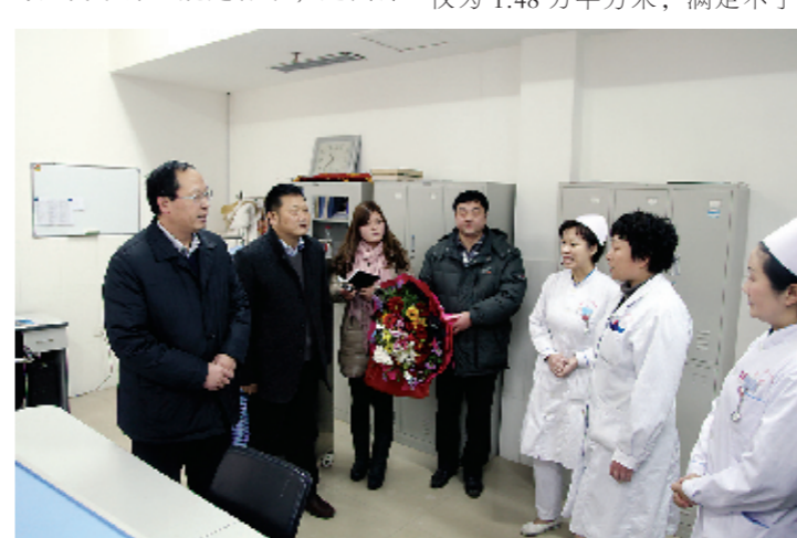
副市长张广东,市卫生局局长郝宝良到该院调研

先进的诊疗技术、优质的医疗服务,让周口市参合患者在家门口就能享受到省级医院的医疗和服务,周口市中心医院的知名度和参合患者满意度也因此不断提高。 悬壶济世勇担当,竭力尽心遂民愿。采访时,刘炯表示:“要想真正为参合农民解难分忧,为参合患者解除病痛,必须始终把他们的利益放在首位,忠实履职,真诚服务,便民新农合的道路才会越走越宽广,惠民之歌才会越唱越响亮!”