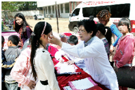
专家走基层活动现场