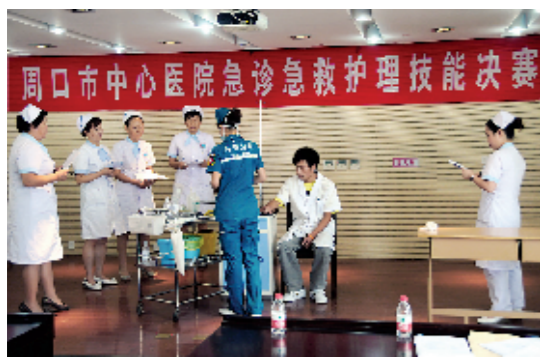
急救护理技能比赛