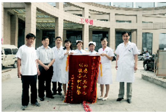
参合患者为该院医护人员送来锦旗